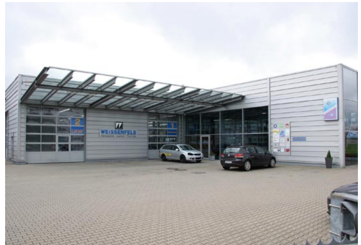
Hell und offen ist der Empfangsbereich für den Kunden und sein Fahrzeug gestaltet: Neben der Eingangstür sind links die Tore für die Annahme von Pkw und Nfz. Rechts weisen die Schilder auf die Versicherungen und die Eurogarant-Mitgliedschaft hin