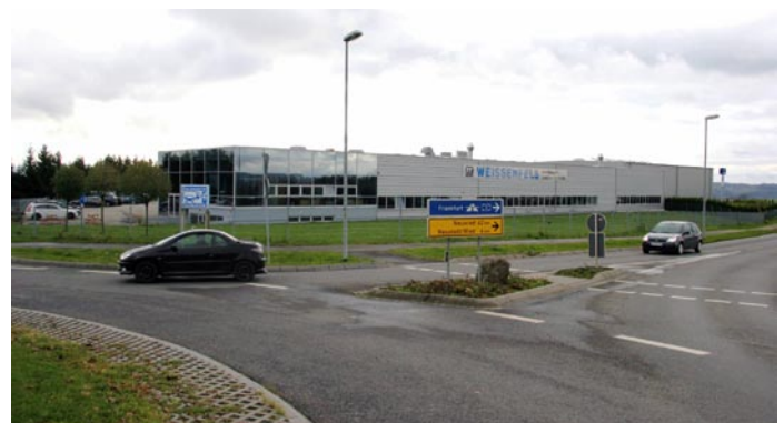
Erst das beleuchtete Fachbetriebszeichen in der Grünfläche verrät, dass in diesem modernen Gebäudekomplex ein Karosseriefachbetrieb untergebracht ist