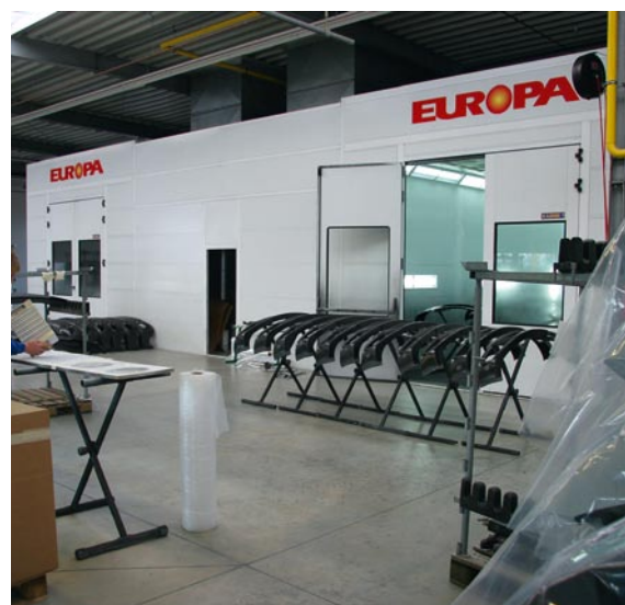
Bei der Industrielackierung werden die zahlreichen Serienteile einzeln mit der Hand nachgeschliffen, um die gewünschte Oberflächenqualität zu erreichen