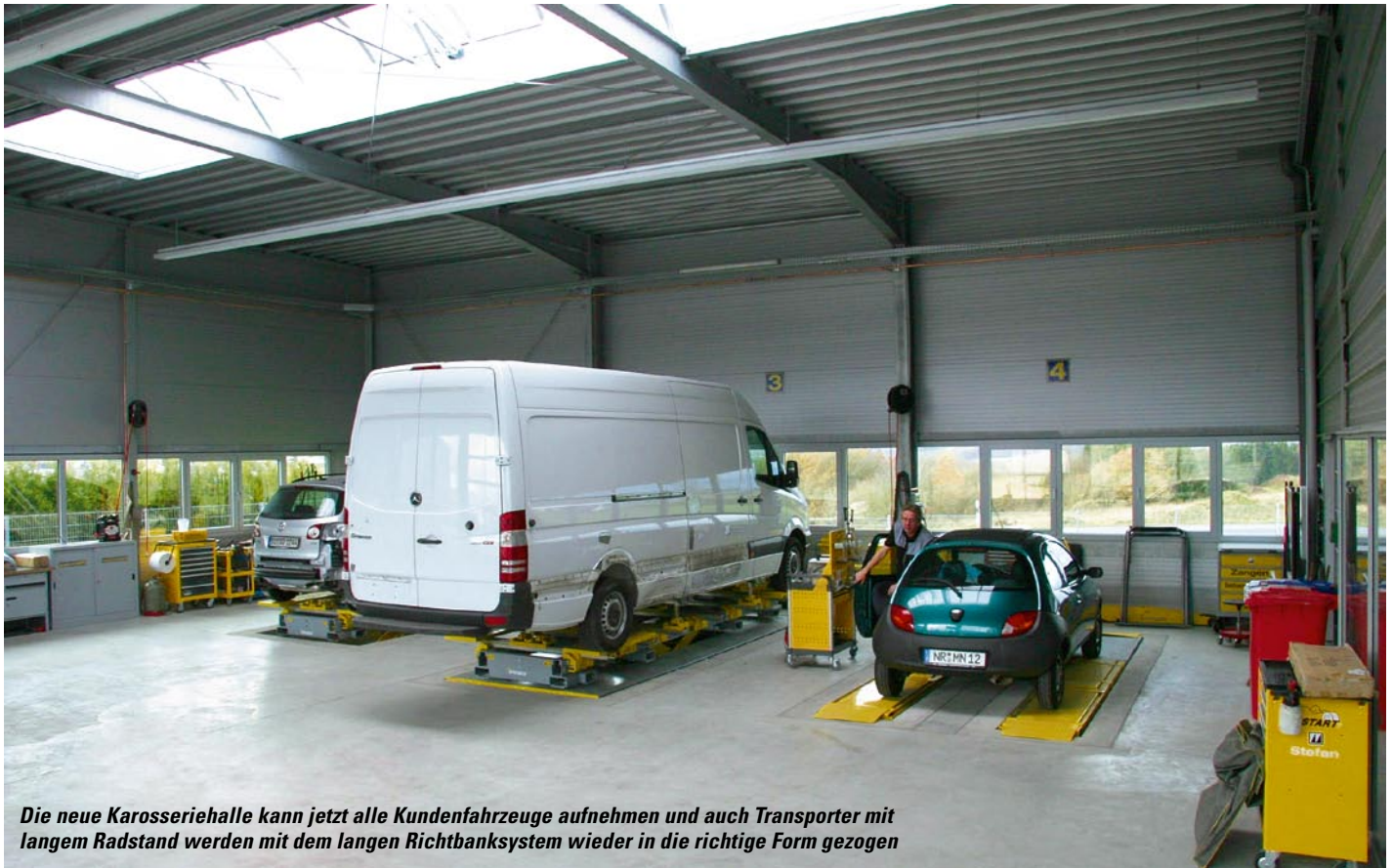
Die neue Karosseriehalle kann jetzt alle Kundenfahrzeuge aufnehmen und auch Transporter mit langem Radstand werden mit dem langen Richtbanksystem wieder in die richtige Form gezogen

Fixierung des Fahrzeuges genutzt. Eine gewisse Maßkontrolle der Karosserie ergibt sich praktisch von selbst. An den beiden Richtbänken können fünf ausgebildete Mitarbeiter arbeiten und zusätzlich lässt sich das Motto „Richten statt erneuern“ gut umsetzen.